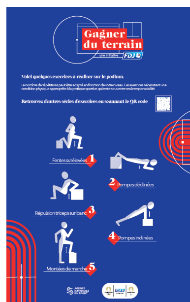
Exemple de panneaux

Ces dessins présentent un exemple des habillages des éléments composant la zone d'échauffement telle qu'imaginée par les Partenaires. Chaque zone d'échauffement s'adaptera à son environnement, aux caractéristiques du terrain (dimensions, type de sol, nivellement) et à l'équipement sportif associé.